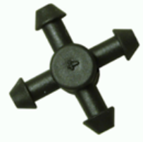
MANIFOLD DE 4 SALIDAS PARA MICROTUBO