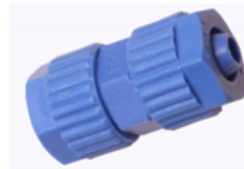
COPLAS UNION ROSCADA 2 TUERCAS