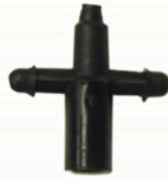
MANIFOLD DE 2 SALIDAS PARA MICROTUBO