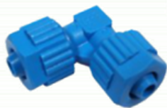
CODOS MACHO 2 TUERCAS