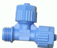
TEE MACHO ROSCA ASIMETRICAS