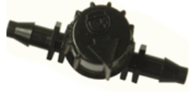
MINIVALVULAS PARA MICROTUBO 4 MM