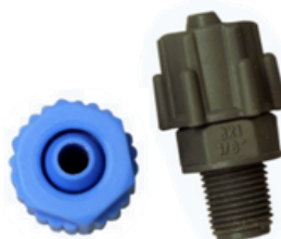
CONECTORES MACHO 1 TUERCA