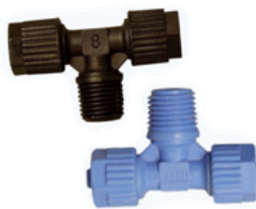
TEE MACHO 2 TUERCAS