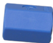
COPLAS HI 1/4" - 1/8"