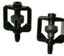
HIT - PRO