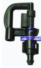
AQ 210 REGULAR